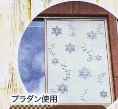
プラダン使用 遮ネプラ直貼遮熱