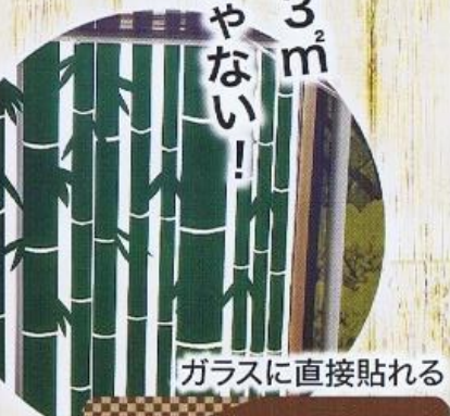
ガラスに直接貼れる ガラス直貼遮熱