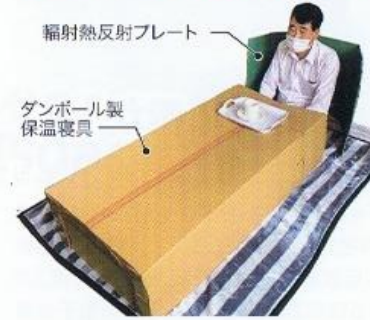
背面: 輻射熱反射プレート (幅1.3m×高さ0.7m) 前面: ダンボール製保温寝具 (高さ0.3m×幅0.6m×長さ1.6m)

ダンボールやプラダン等の片面に遮熱カラーテープAZを貼り、遮熱カラーテープAZが体側になる様にセットすれば完成です。上記写真は、輻射熱反射プレートとダンボール製保温寝具の両方を使用し、くつろいでいるところです。両方作っても、遮熱カラーテープAZ1個位で出来ます。